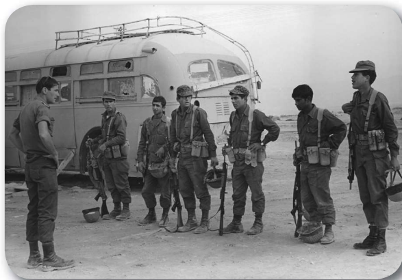
נח"ל משואה, 1970

הקיבוץ המאוחד, הקיבוץ הדתי, תנועת המושבים ותנועת העובד הציוני על האפשרות לאזרח את משואה. "הוועדה להתיישבות חדשה" - גוף שנועד לפשר בין התנועות המיישבות במקרים כאלו - הכריעה לבסוף בעד תנועת העובד הציוני. 43