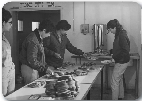
נח"ל משואה, 1970

היאחזות נוספת במרכז הבקעה הייתה משואה, שקמה בשפכו של נחל פרעה (גיפתליק, תרצה). בתחילה דחה שר הביטחון דיין את התוכנית להקמת ההיאחזות באזור זה, ככל הנראה מכיוון שהמיקום היה קרוב מידי לציר דמיה-שכם. 41 שנה מאוחר יותר, בנובמבר 1969, שונה מיקומה של ההיאחזות והיא עלתה אל הקרקע מדרום לציר ואוישה בידי גרעינים של הקיבוץ הדתי. 42 גם מיקומה של היאחזות זו נקבע בשל מצאי קרקע בבעלות ממשלתית ושל מים לשתייה ולחקלאות, שסופקו מבארות וממעיינות ואדי נחל פרעה. ההתיישבות הצליחה מבחינה משקית, והוקם בה גן ירק גדול בשטח של 500 דונם. בעקבות ההתפתחות המשקית המהירה נאבקו תנועות