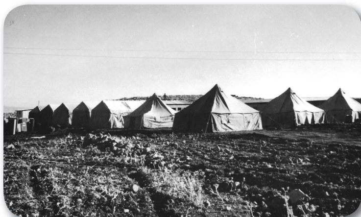
נח"ל מכורה, יום העלייה לקרקע, 1973

בנקודת הקבע, 77 ואגף התיישבות והגמ"ר קבעו כי אין לפרסם את דבר הקמתה. 78