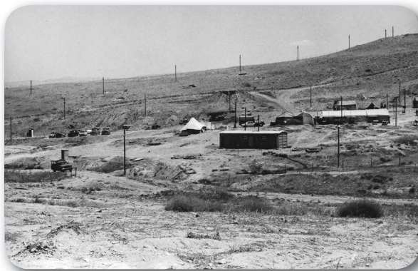
נח"ל מחולה 1968

גם הקמת היאחזות בקליה נבעה מרצון של יישובי הספר הוותיקים